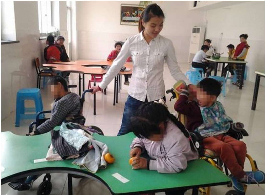
在残婴院服务的志愿者